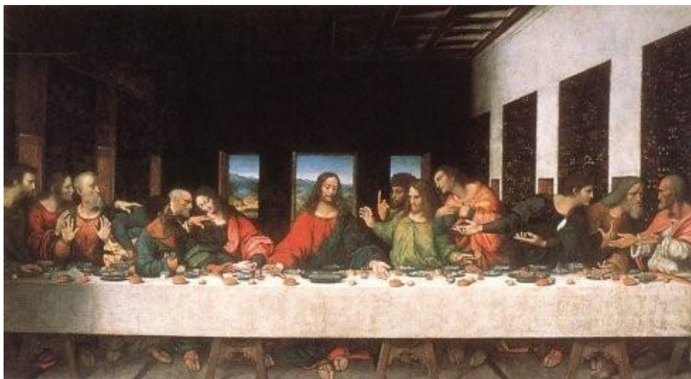
《最后的晚餐》达芬奇（Leonardo Di Ser Piero Da Vinci 1452-1519）

难道这是科学和艺术的共谋吗？这种相对性的畸变，反映在科学的理性与艺术的感性，它昭示我们一个道理，科学与艺术作为文化的不同表象，互相交织，彼此呼应，一起弹奏了文明的交响，并一起引领人类迈向全球化道路。